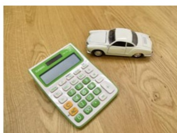
クレジット金利の優遇