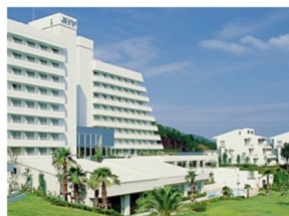
映画やレジャー施設の割引