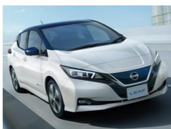
新車中古車購入時の割引

長野日産自動車の社員は社員割引購入制度が利用できます。なんとこの社員割引は2親等の家族まで利用が可能です。