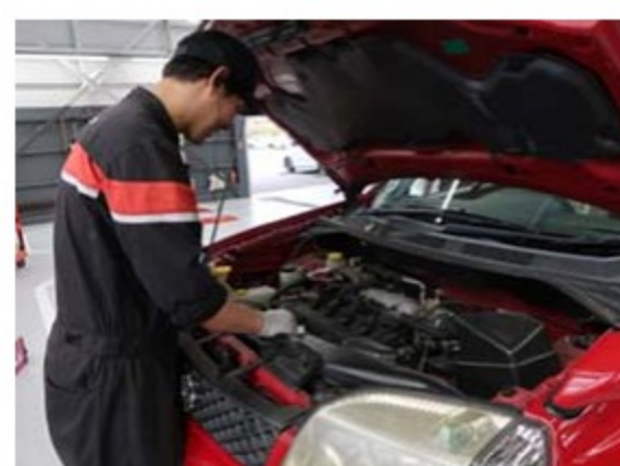
整備及び修理代の割引